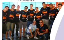
Equipe do vôlei na feijoada da Fundação Sara

Os voluntários totalizaram 7.200:57:00 horas de trabalho distribuídos em 12 equipes : Serviços Gerais, Passeioterapia, Artesanato, Transporte, Plantão, Alegria, Amor, Eventos, Diretores/Gestores/Assessores, Educação, Pedagógica e Profissionais liberais.