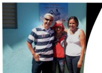
Inauguração casa de São Francisco

Capacitou 129 profissionais de saúde atuantes em PSFs de Matozinhos e Lagoa Santa com objetivo de disseminar o conhecimento acerca do câncer infantojuvenil e reduzir os índices de mortalidade infantil através do diagnóstico precoce. Foram investidos R$76.399,36 no programa. A Escola Viva realizou 36 encontros (atendimentos aos assistidos), com um total de 90 horas, por pedagogas voluntárias.