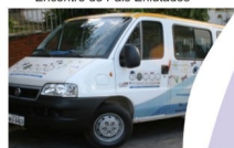
Veículo da Fundação Sara

Adquirimos 723 medicamentos e 05 próteses , realizamos 78 exames , 11 apoios em funerários . Realizamos 11 festas e recreações da Equipe da Alegria. Investimento total de R$ 63.979,02 .