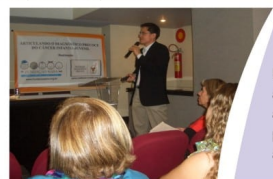
Aula do Projeto Diagnóstico Precoce

Foram arrecadados R$ 167.177,92 no McDia Feliz 2010, que serão investidos na reforma da oncologia pediátrica da Santa Casa de Belo Horizonte, buscando a humanização e melhoria do ambiente hospitalar.